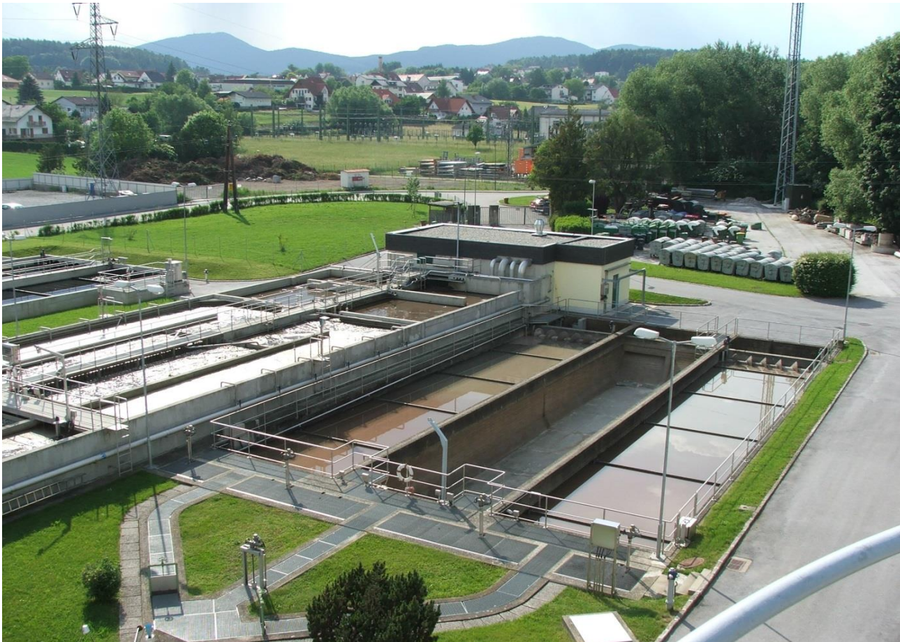
Kläranlage Weiz – Wärmeabgewinnung zur Beheizung und Kühlung

Mit einer umweltfreundlichen und wirtschaftlich konkurrenzfähigen Bereitstellung von Strom und vor allem (Niedertemperatur-)Wärme kann die Abwasserinfrastruktur aber auch zur externen Versorgung der umliegenden Infrastruktur beitragen und dabei einen wesentlichen Beitrag zur Umsetzung der Energiewende leisten. Für die Erschließung der heute noch vielfach ungenutzten thermischen Abwasserenergiepotenziale kommt der Betrachtung des räumlichen Umfeldes der Kläranlagen somit eine große Bedeutung zu.